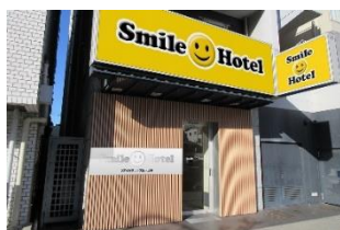
スマイルホテル大阪天王寺 (本投資法人保有物件)