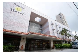
スマイルホテル那覇シティリゾート (本投資法人保有物件)