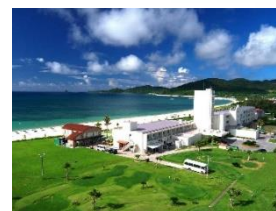
EN RESORT Kumejima EEF Beach Hotel