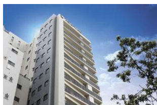
ホテルウィングインターナショナル セレクト上野・御徒町 (本投資法人保有物件)